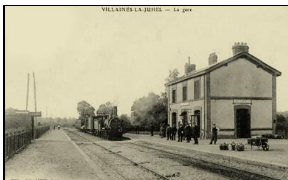
La gare de Villaines côté cour et côté quais