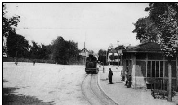
Autres vues du terminus du tacot de Barbizon sur la place de la gare de Melun