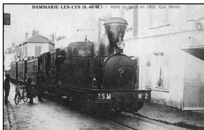
Il n'y avait pas de gare à Dammarie les Lys Le petit train traversait la localité par sa Grand-Rue et faisait des arrêts à la demande

Ci-contre et ci-après, avec la prolongation de la ligne vers Milly la Forêt, la gare de Chailly en Bière devint la bifurcation entre les lignes de Barbizon et de Milly