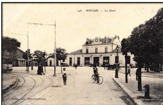
Le début du parcours devant la gare de Melun