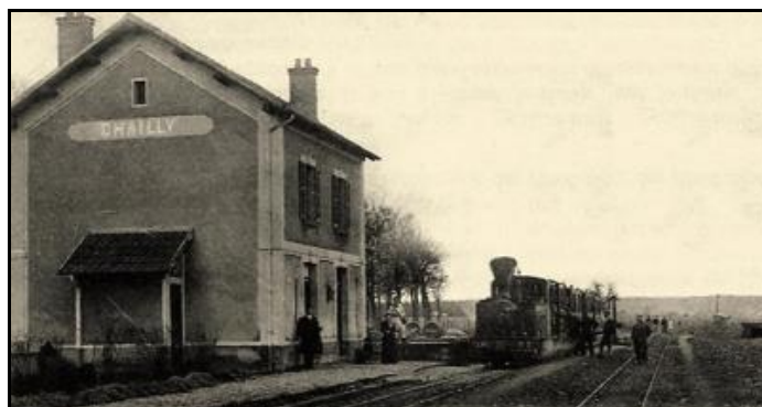
Ci-dessus et ci-dessous, hier et aujourd'hui, la gare de Chailly