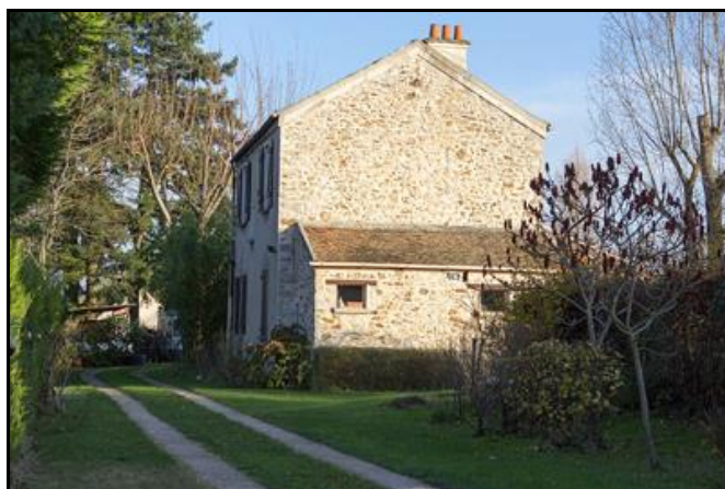
La gare de Perthes devenue propriété privée, est cachée par d'autres maisons et assez difficile à voir