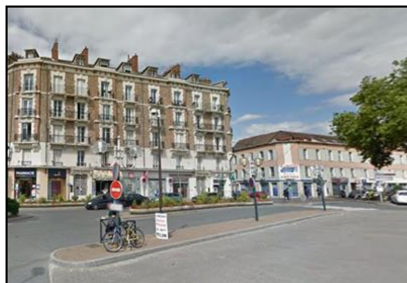
Le même endroit hier et aujourd'hui