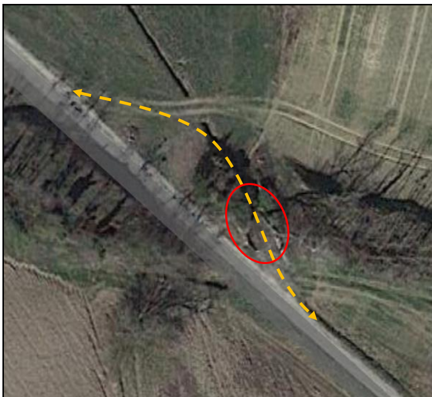
Vue aérienne des culées du pont et de l' ancien tracé de la route

Si cette fiche comporte des erreurs ou des oublis, merci de nous le signaler.