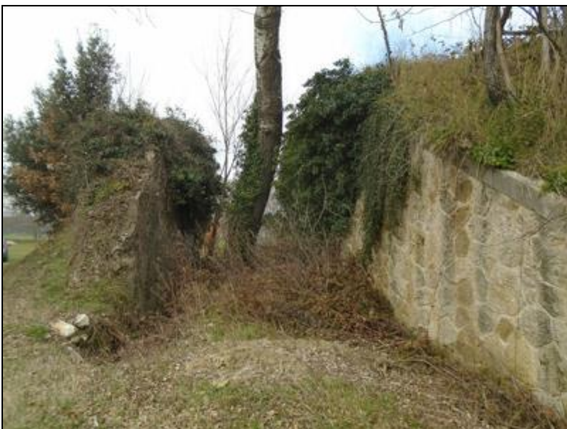
L'extrados de la première culée, ici à gauche, a été détruit pour donner passage au nouveau tracé de la route