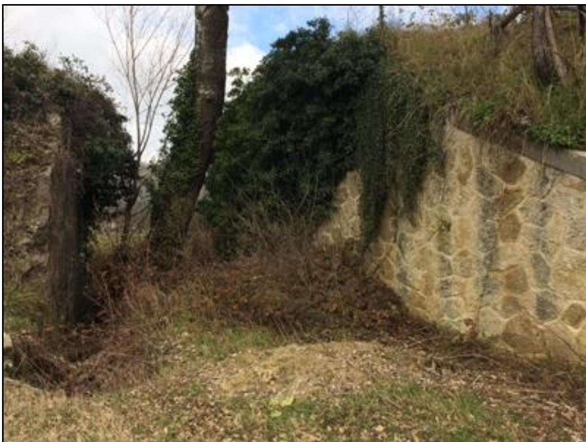
Ci-dessus et ci-dessous, les vestiges du pont au milieu duquel pousse un arbre