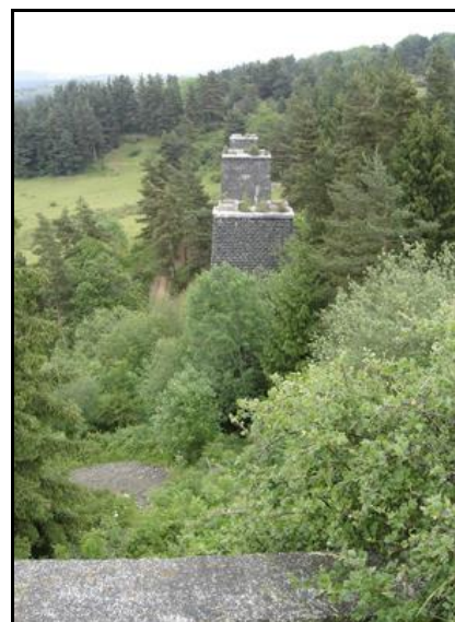
Ci-dessus et ci-dessous, diverses vues des piles