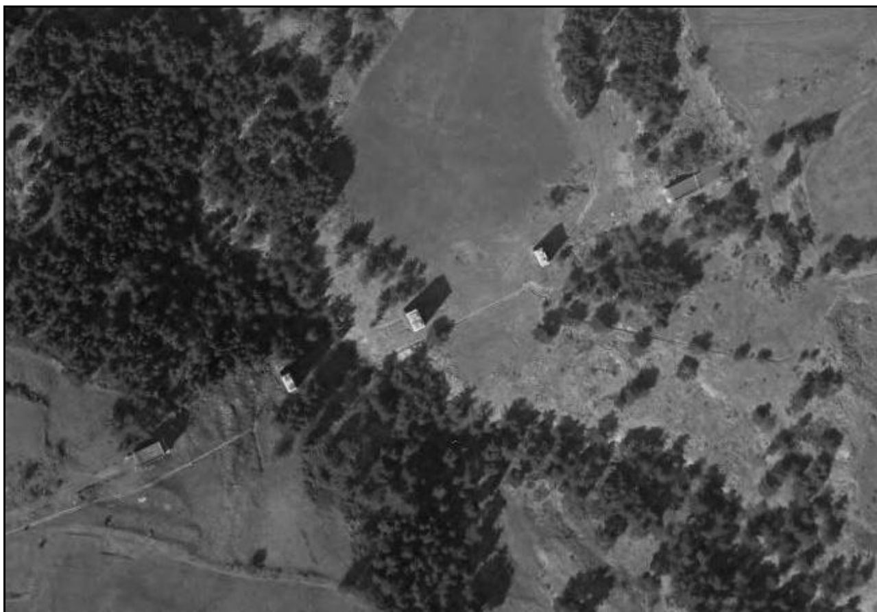
Vue aérienne des vestiges : les culées et les trois piles du viaduc

Comme il était inutile, il a été vendu en 1963 à un ferrailleur qui en a récupéré le tablier. Il n'en reste donc que les culées et les quatre piles en maçonnerie.