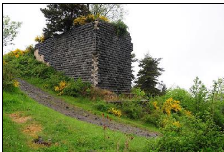
Et la deuxième culée de l'ouvrage

Si cette fiche comporte des erreurs ou des oublis, merci de nous le signaler.