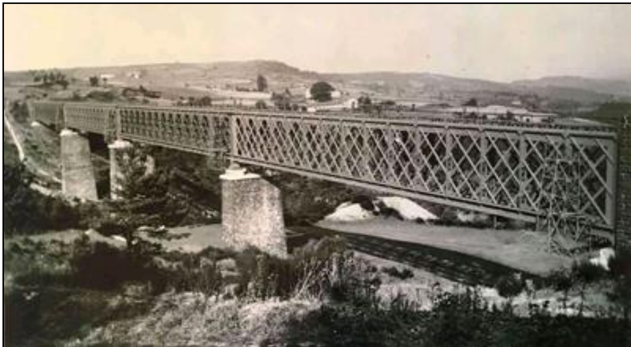
Le viaduc des Chabannes dans toute sa splendeur

Comme il était inutile, il a été vendu en 1963 à un ferrailleur qui en a récupéré le tablier. Il n'en reste donc que les culées et les quatre piles en maçonnerie.