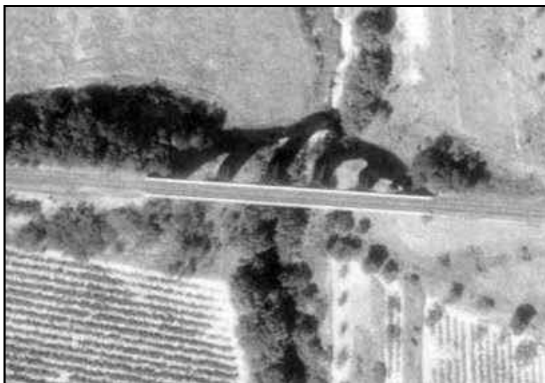
Ci-dessus et ci-dessous, le viaduc, hier et aujourd'hui

Viaduc en maçonnerie classique comportant 5 arches plein cintre.