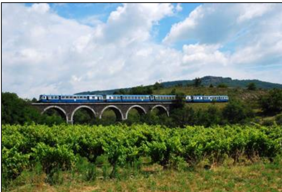
Le viaduc, du temps de la ligne du Teil à Vogüé