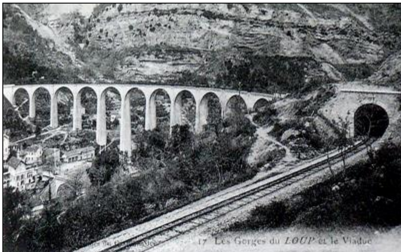
Le viaduc et la sortie du tunnel du Loup

Si cette fiche comporte des erreurs ou des oublis, merci de nous le signaler.