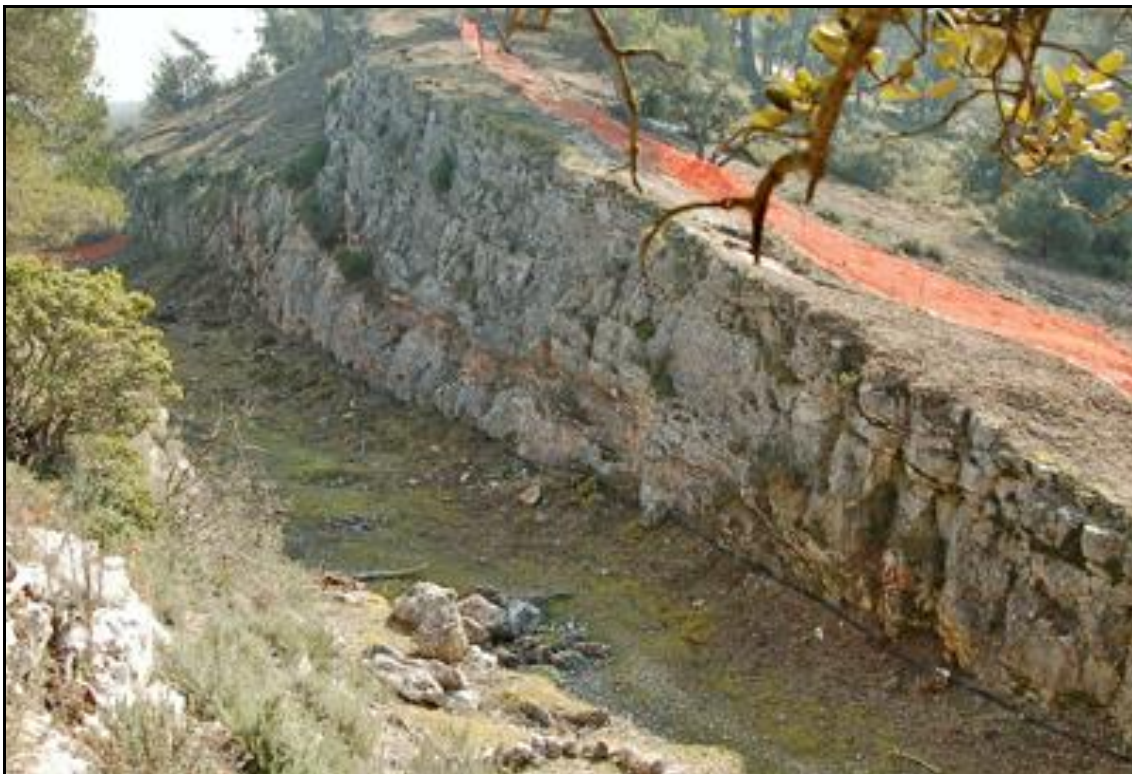
L'extrados du toit de la tranchée couverte peu avant les travaux de destruction La galerie se trouvait dessous

Tranchée couverte qui a été détruite pour cause d'élargissement de la tranchée en vue du doublement des voies de la ligne Aix > Marseille.