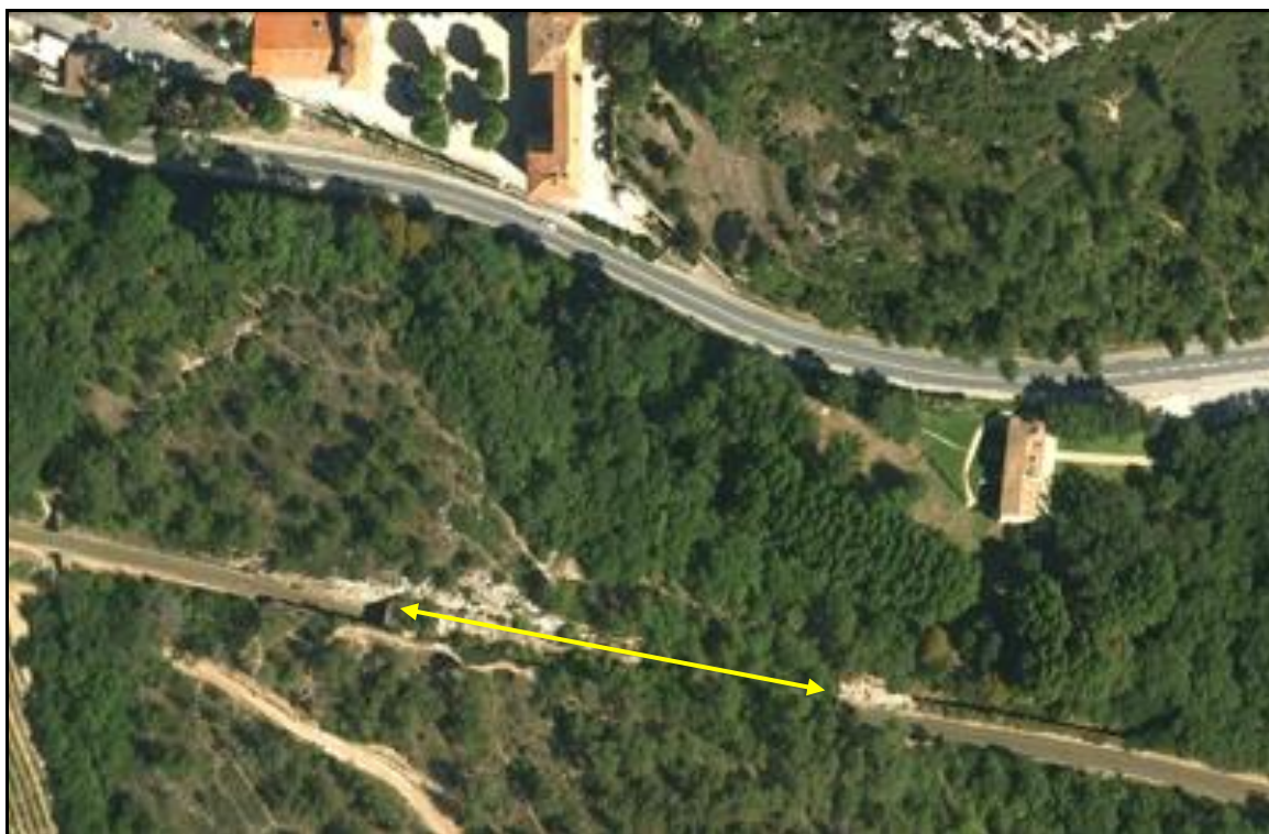
Vue aérienne de la tranchée couverte