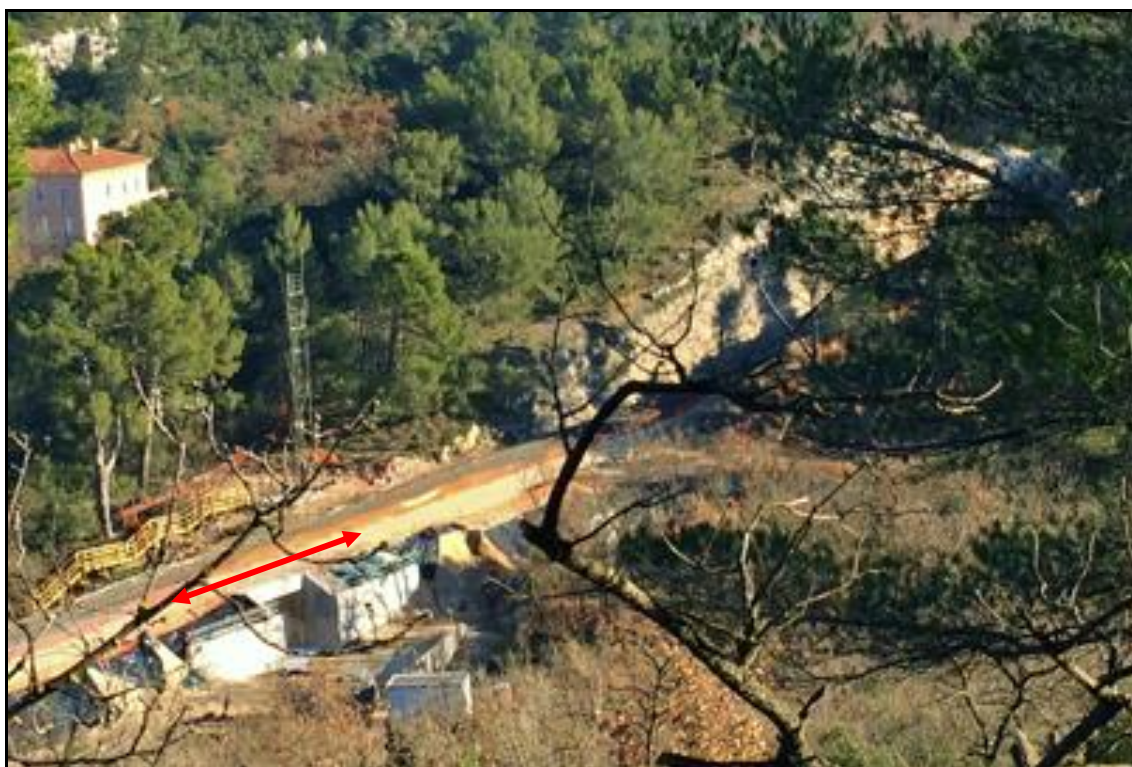
La tranchée éventrée et en cours d'élargissement pour permettre la pose d'une deuxième voie (flèche) Noter le pont lui aussi modifié et élargi pour la même raison