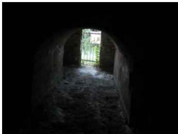
L'entrée et la sortie vues de l'intérieur

L'accès à l'entrée du tunnel côté Lesquerde ne peut se faire que pédestrement. Elle est assez difficile à trouver. Elle n'est pas fermée et le souterrain peut se traverser. Mais attention, son état est extrêmement dangereux.