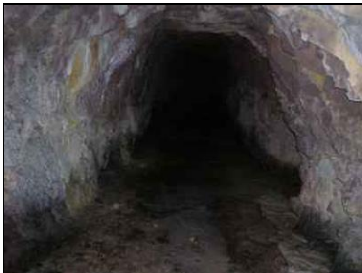
L'intérieur de la galerie dans une partie où elle est en bon état

Côté Saint Paul, par contre, l'accès peut se faire par un chemin carrossable, mais la sortie est fermée.