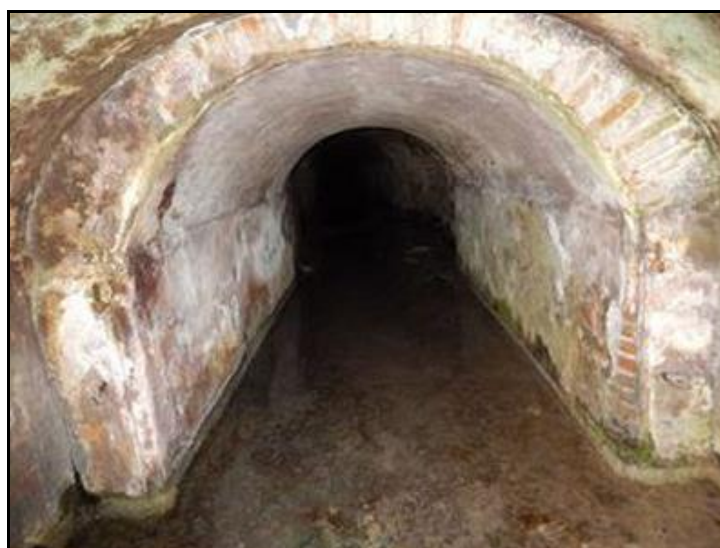
La galerie inondée derrière la grille de la sortie